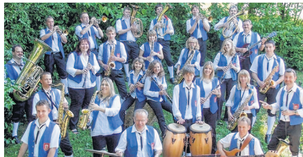
Die Impfing Musikanten laden wieder zum Ploofest.